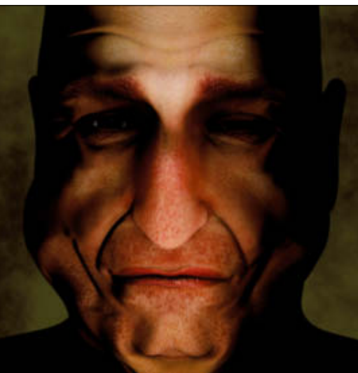
Animieren leicht gemacht. Kobold Charakteranimation hat ein typisches Posermodell – Victoria 3 – für Cinema 4D modifiziert.