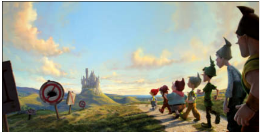
„Der 7bte Zwerg“ ist das bisher größte Projekt für Trixter.