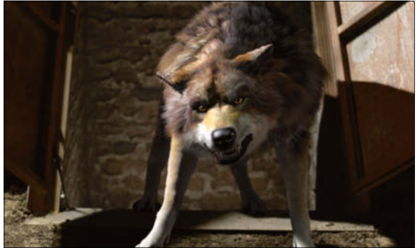
„Iron Man“ und die BBC-Kinderserie „Wolfblood“ sind Projekte, an denen Trixter arbeitete.