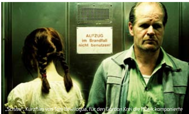
„Scissu“, Kurzfilm von Tom Bewilogua, für den Gordon Krei die Musik komponierte

Zu seinen filmischen Arbeiten neben dem animago gehört unter anderem die Musik für „Scissu“, ein von dem Hamburger Nachwuchsregisseur Tom Bewilogua geschriebener und in Szene gesetzter Kurzfilm. Er erzählt in narrativ ambitionierter Form vom Aufeinander-