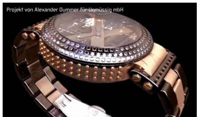
Projekt von Alexander Dummer für Unmüssig mbH

Etwas mehr als 200 Beiträge musste er dafür sichten. „Ich habe sie zunächst nach Gruppen sortiert, dramatische gegen ruhige, lustige gegen traurige, solche mit bunten, auffälligen Bildern gegen eher zurückgenommene. Dann habe ich die Schnitzel angeordnet und verschoben, bis sich eine sinnvolle Abfolge ergab.“ Etwa eineinhalb