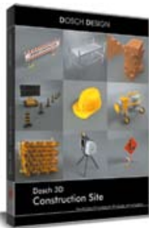
Dosch 3D: Construction Site