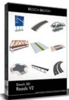
Dosch 3D: Roads V2