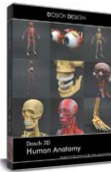
Dosch 3D: Human Anatomy