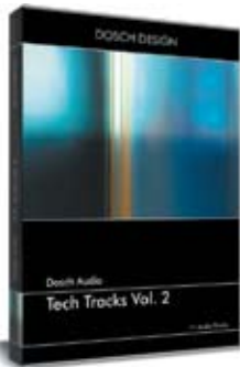
Dosch Audio: Tech Tracks Vol. 2