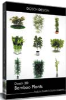
Dosch 3D: Bamboo Plants