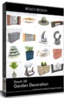
Dosch 3D: Garden Decoration