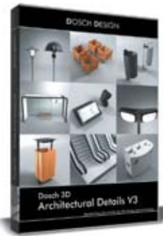
Dosch 3D: Architectural Details V3