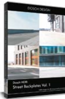
Dosch HDRI: Street Backplates Vol. 1