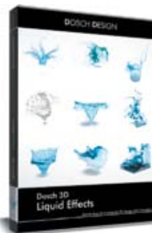
Dosch 3D: Liquid Effects

Animierte Filmsequenzen \geq Dosch Movie-Clips, Photoshop 3D-Modelle und Layer-Bilder \geq Dosch Images sowie Musik- und Soundeffekte \geq Dosch Audio runden das Angebot ab.