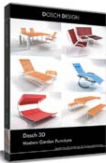
Dosch 3D: Modern Garden Furniture