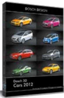
Dosch 3D: Cars 2012