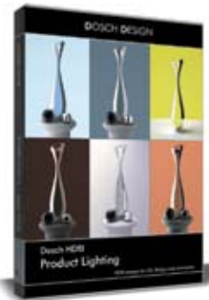
Dosch HDRI: Product Lighting