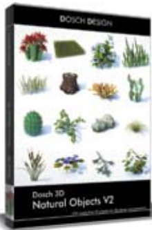
Dosch 3D: Natural Objects V2