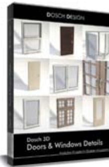
Dosch 3D: Doors & Windows Details