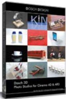
Dosch 3D: Photo Studios for Cinema 4D