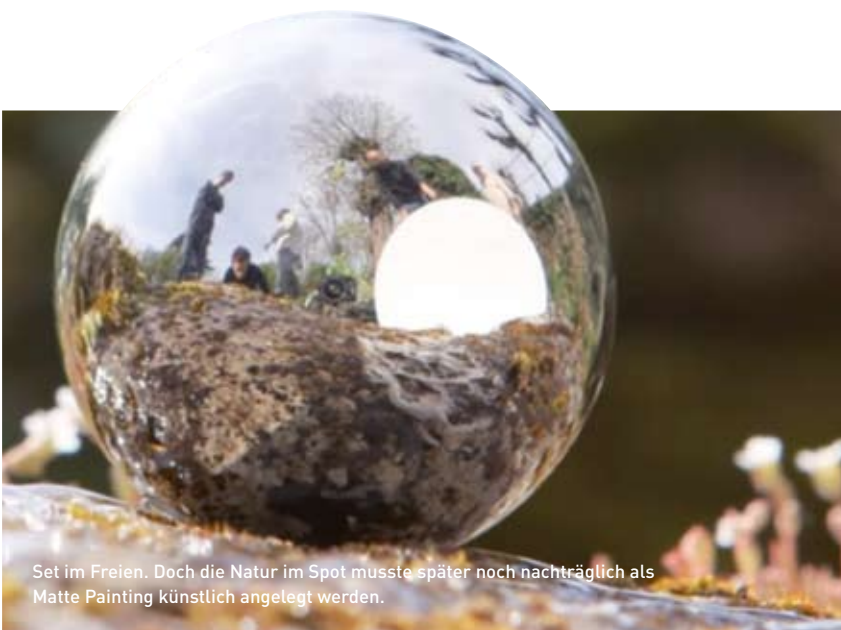
Set im Freien. Doch die Natur im Spot musste später noch nachträglich als Matte Painting künstlich angelegt werden.

Dann wurde der Schnecke in eine Waldlandschaft auf die Schleimspur gebracht. Mangels originalem Grün in der unmittelbaren Umgebung des Studios von WIZZ Design im Pariser Vorort Clichy musste die umgebende Natur als Matte Painting künstlich angelegt werden. Das Team arbeitete 45 Tage an dem Projekt. Das Modeling der Schnecke dauerte sechs Tage. Weitere 14 Arbeitstage benötigten Animation und